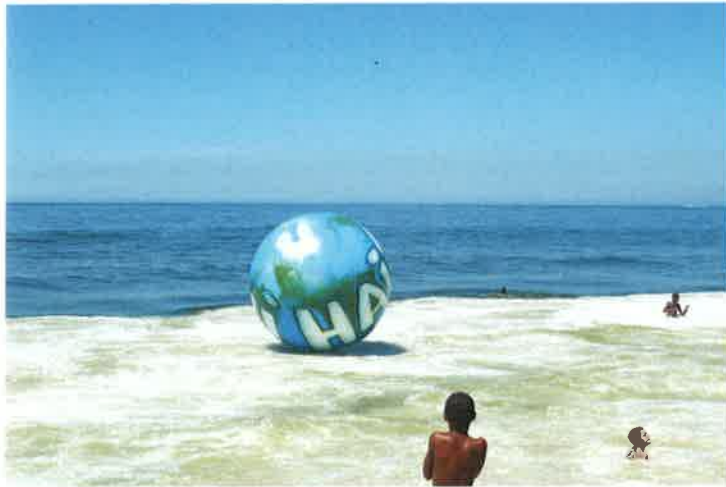
Frente 3 de Fevereiro, Arquitetura da Exclusão [Arquitectura de la exclusión], 2010, digital foto.