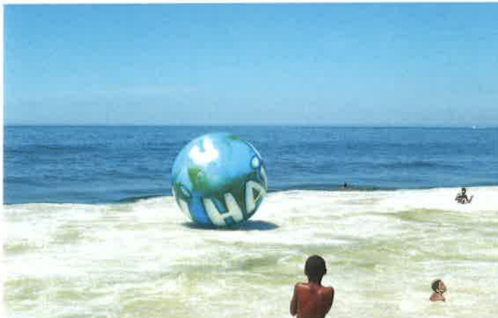
Frente 3 de Fevereiro, Arquitetura da Exclusão [Architecture of Exclusion], 2010, digital photo.